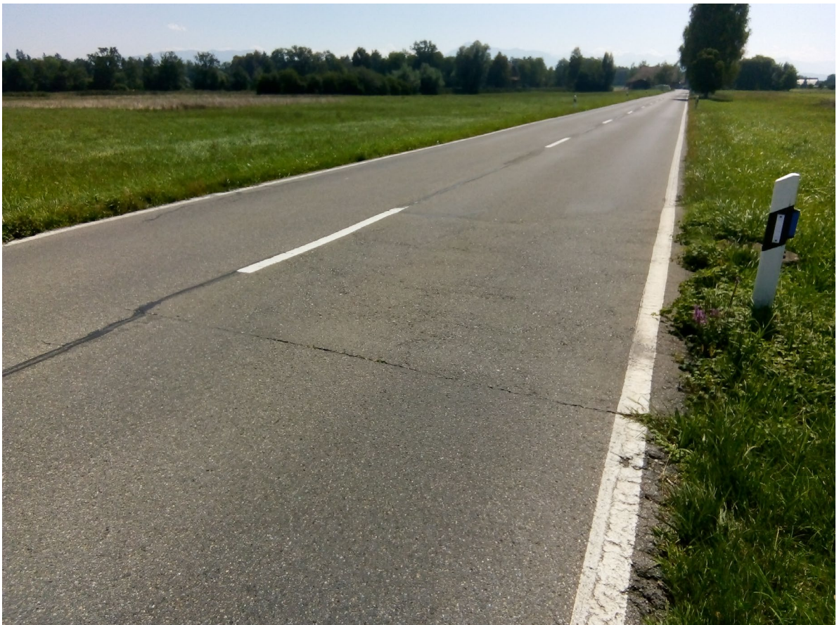
Aktuelle Aufnahme der Maschwanderstrasse in Hünenberg, die bald saniert wird.